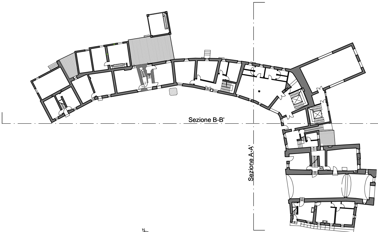
Planimetria di riferimento scala 1:500